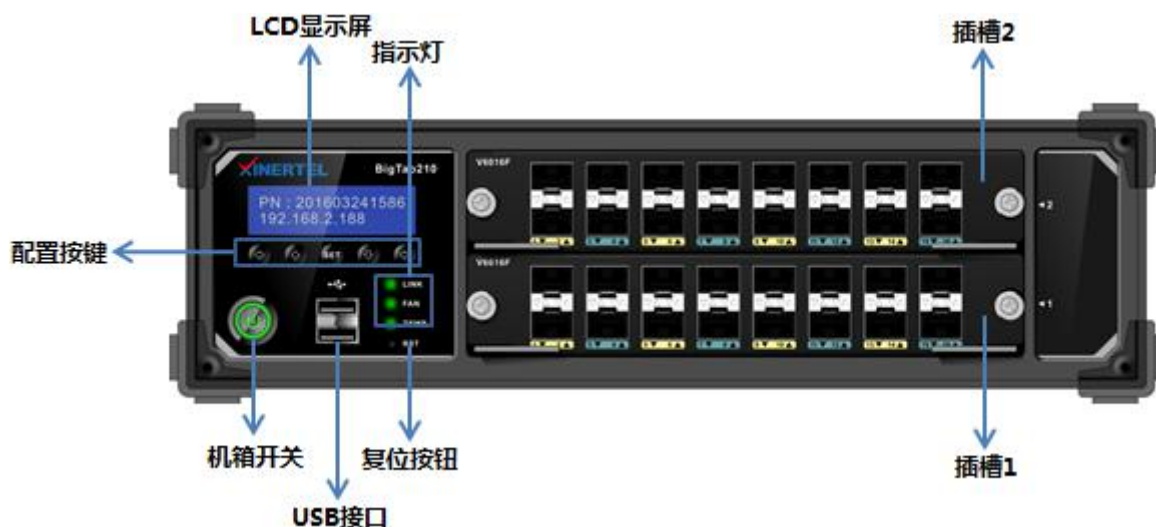
图 1 信而泰 BigTao210 前面板示意图